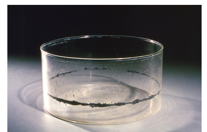
Fotos de Aedes aegypti los huevos del mosquito