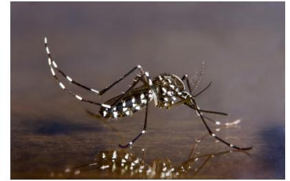
Imagen de Aedes albopictus (mosquito tigre asiático)