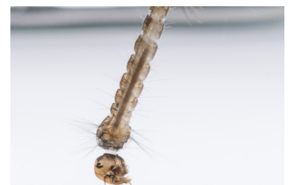
Cuadro de Aedes notoscriptus de mosquitos larvas