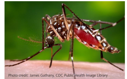
Imagen de (Australian patio trasero Mosquito)