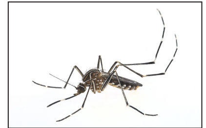
Imagen de Aedes aegypti (mosquito de la fiebre amarilla)